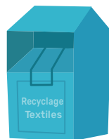
BORNE À TEXTILES

Les vêtements, chaussures, linge de maison sont collectés dans les bornes. En bon état ils finiront en friperie, sinon les textiles seront défibrés, broyés et traités pour devenir de nouveaux produits tels que des isolants ou des chiffons industriels