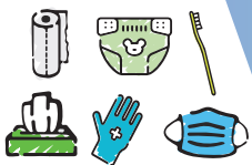
Les tissus sanitaires