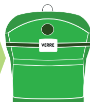
COLONNE A VERRE

Les bouteilles et bocaux en verre doivent être déposés dans les colonnes à verre car ils se recyclent à 100% et à l'infini. Par contre, les verres de table et la vaisselle en verre ne se recyclent pas et doivent être déposés en déchetterie