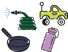
Les objets métalliques ou en plastique