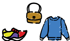
Le textile, chaussures et linge de maison