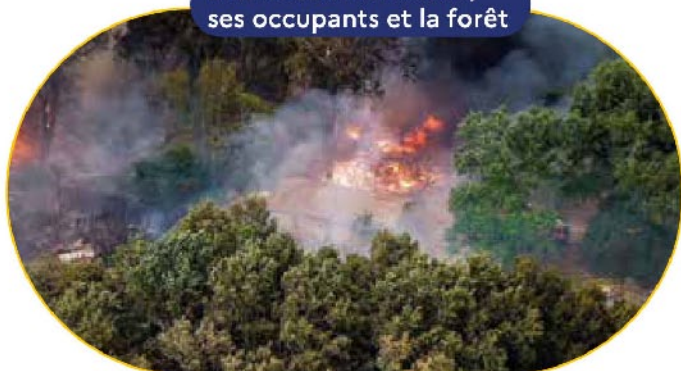
Terrain non débroussaillé menace sur la maison, ses occupants et la forêt