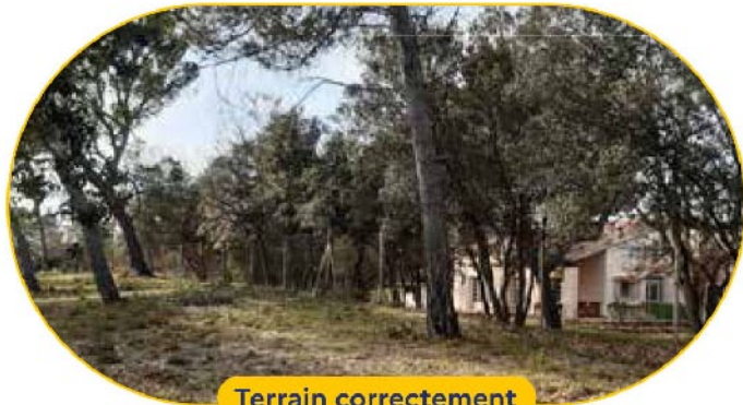
Terrain correctement débroussaillé maison et forêt protégées

Avec le changement climatique, les feux de forêt et de végétation sont de plus en plus forts et intenses. Le débroussaillage des abords de son habitation est le meilleur moyen de se protéger, de protéger ses biens et la nature environnante, face à ce danger.