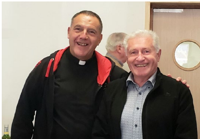
« Père et Maire » ... heureux ! ... ... Paroissiens... heureux !!